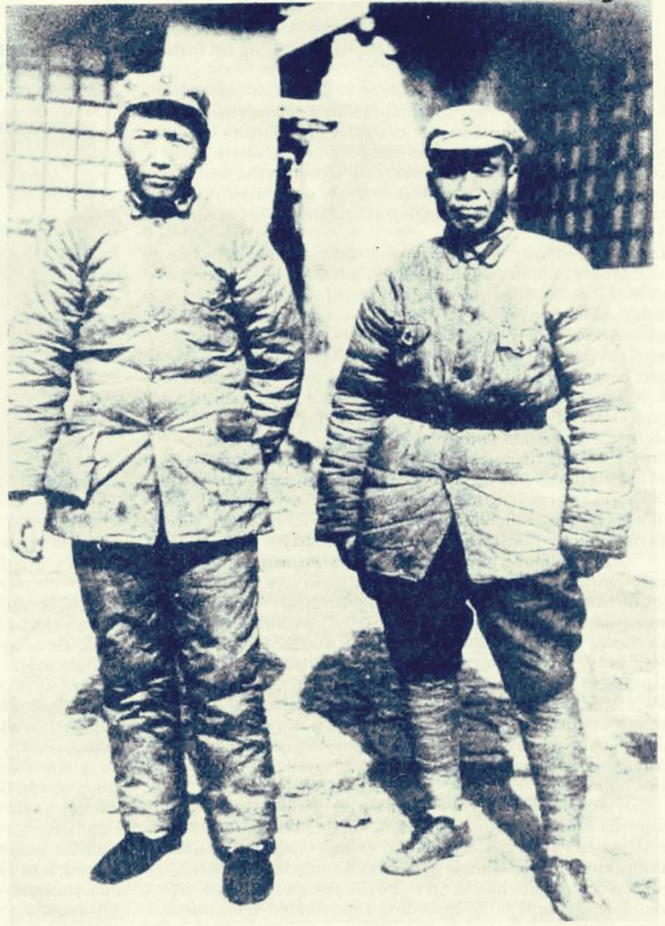
Mao Zedung ve Halk Ordusu Komutanı Çu-Teh

"Kitlelerle bağ kurabilmek için, onların ihtiyaçlarına ve isteklerine uygun hareket etmek gerekir. Kitleler için yapılan bütün çalışmalarda, ne kadar iyi niyetli olursa olsun, bir bireyin isteginden değil, kitlelerin ihtiyaçlarından yola çıkılmalıdır. Sık sık şöyle bir durumla karşılaşılır: Kitlelerin objektif olarak belli bir değişikliğe ihtiyaçları vardır, ama subjektif olarak henüz bu ihtiyacın bilincine henüz istekli ya da kararlı değildirler. Böyle durumlarda sabırla beklemeliyiz. Çalışmalarımız sayesinde kitlelerin çoğunluğu o ihtiyacın bilincine varıncaya ve değişiklik için istekli ve kararlı bir hale gelinceye kadar o değişikliği yapmamamız gerekir. Aksi takdirde, kendimizi kitlelerden tecrit ederiz. Kitleler bilinçli ve istekli olmadıkları sürece, onların katılmalarını gerektiren bütün çalışmalar, kağıt üzerinde kalır ve başarısızlığa uğrar... Burada iki ilke söz konusudur. Birincisi, kendi kafamızdan kitlelere yakıştırdığımız ihtiyaçlar değil, onların gerçek ihtiyaçları; ikincisi bizim kitleler adına kararlaştırdığımız istekler değil, kitlelerin kendi başlarına kararlaştırdıkları istekler."