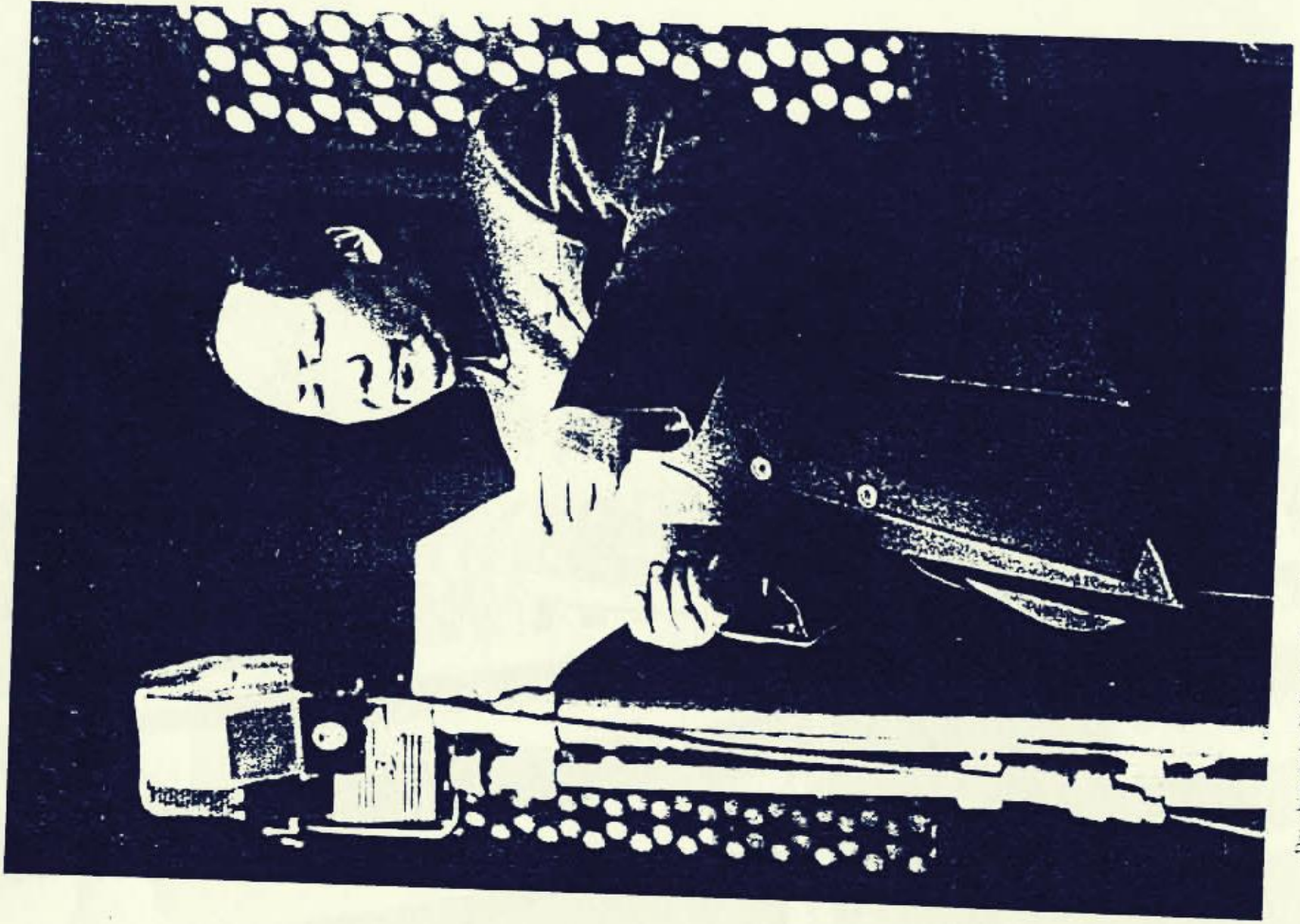
"Das chinesische Volk ist aufgestanden." Am 1. Oktober 1949 verkündete Mao Zedung auf der Plenarsitzung des Politbüros feierlich die Gründung der Volksrepublik China.

linde formüle edilen bu diyalektik,, sınıf mücadelesi açısından tayin edici öneme sahiptir. Toplumda sürekli eski ile yeni arasında çatışmanın devam ettirilmesi toplumun devrimleştirilmesi toplumdaki insan unsurunu malzeme olarak ele alıp bu malzemeyi nakış nakış işleyerek yeni ve ileri toplumların daha güçlü temellerini yaratma ancak düşünce madde arasındaki diyalektik bağın doğru kavranabilmesi ile mümkündür. Mao Zedung aynı zamanda marksist bilgi teorisinin gelişim diyalektiğini açmış ona daha geniş bir anlam kazandırmıştır. Bilginin üretim mücadelesi, bilimsel deney ve sınıf mücadelesi üçlü bileşeni kanalıyla doğrularak geliştiğini vurgulamış proleter devrimcilerin bilgilenme çizgisine doğru bir rota kazandırmıştır. Üretim mücadelesinin insanların bilgisinde ana öge olduğunu belirten Mao "insan bilgisi esas olarak üretimdeki faaliyete dayanır" demektedir. Yine "sınıf mücadelesi, sınıfların karşılıklı ilişkileri, birbirleriyle çatışmaları insan bilgisi üzerinde derin etki yaratır" diyerek, devamla bilimsel deneylerin bu gelişimdeki önemine parmak basar. "Başarısızlıklar başarının anasıdır." dediğinde insanların pratik mücadelede kendi tecrübe ve sınıf sezileriyle geliştirdikleri bilgilerini, toplumsal tecrübelerle birleştirmede, yanlışın atılıp doğruya yönelmede sınıf mücadelesinin zengin dene-