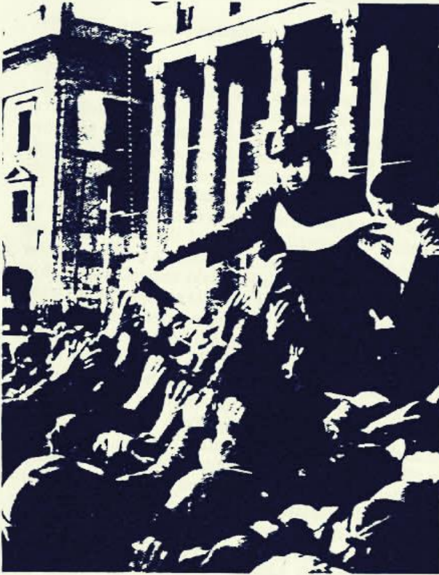
Özellik 1967 - Sunçhisu (Sunçhisu) devlet devriminin "kapitalist yolla devrimlerin devşirdiği" iddialarını çürütürken, sunçhisu kitlelerine önderlik ederken. Mao'nun sunçhisu'dan desteklediği, bu iddiaları çürütürken gösterdiği yolda. Bu sunçhisu, Partinin "devrimci" kitlelerine dağıtılmasını ve kitlelerin çözümlerini bu sunçhisu.