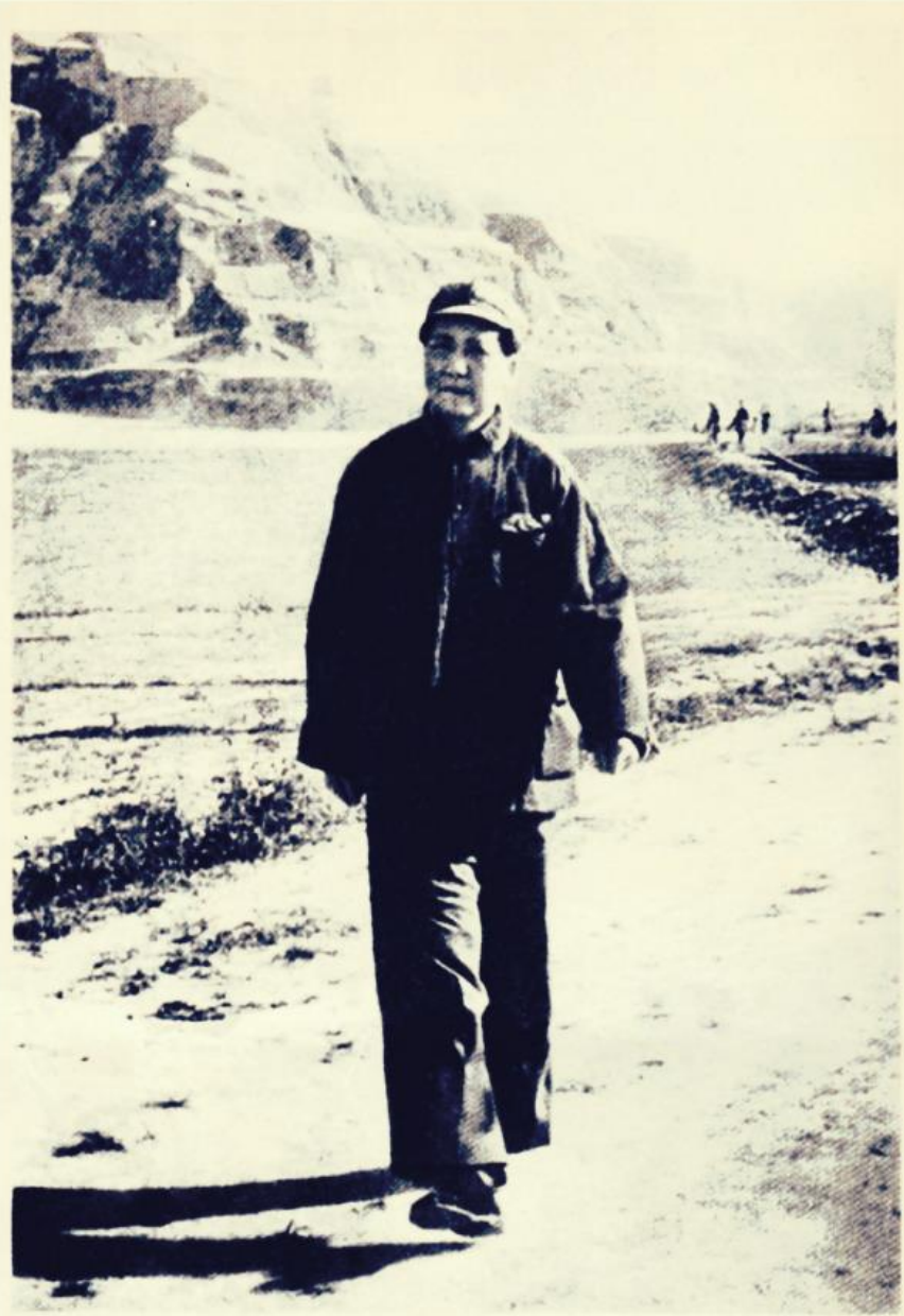
Mao Zedong in Yenan

Bugün sınıf mücadelesi içinde kendi yanlışlarıyla ciddi hesaplaşmaya giren işçi sınıfının öncüleri yeniden MZD'yi kalın bir ayrışım çizgisi olarak görüp, onun öğretileri ile daha iyi silahlanmaları ve gündemin ana maddelerinden biri olarak MZD'yi kabullenmeleri oldukça önemli bir yere sahiptir.