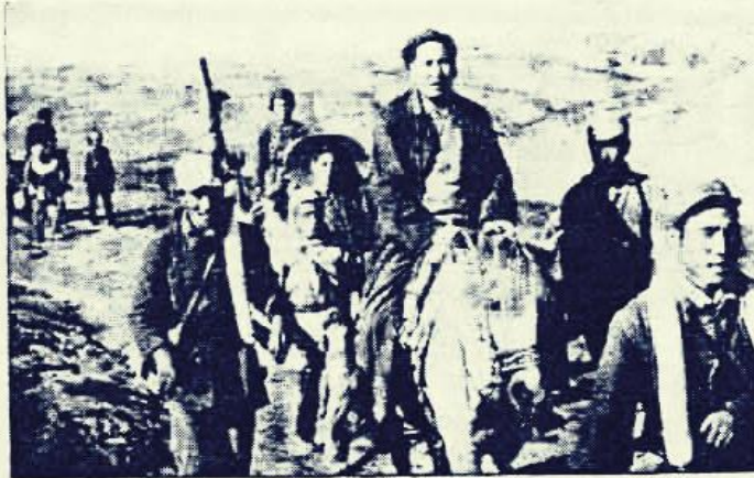
Mao during a battle in Shensi in 1947; behind him, at left, is Chiang Ching.

Çelişkinin özdeşliğini daha da açan Mao Zedung birin ikiye bölünmesini özdeşlik yasasıyla bütünleştirerek bir şeyin başka birşeye dönüşümünün dinamiğini bilimsel olarak ortaya koydu. Çelişme Üzerine adlı makalede O, "Bütün çelişmeli şeyler birbirine bağlıdır. Belli şartlarda tek bir bütün içinde bir arada var olmaktan başka bazı şartlarda birbirine dönüşürler. Zıtların özdeşliğinin tam anlamı budur." dediği zaman ikiye bölünen çelişkinin zıt kutupları arasında cereyan eden mücadelenin iki kutuptan birinin diğerini alt ederek yeni bir niteliğe dönüştüğünü vurgulamaktadır. Burada temel sorun çelişkinin iki zıt kutubunun hem birbirinin varlık koşullarını oluşturması, hem de bazı koşullarda birbirlerine dönüşmesidir.