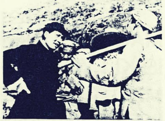
Mao Tsetung talking with peasants in Yenren, 1939.