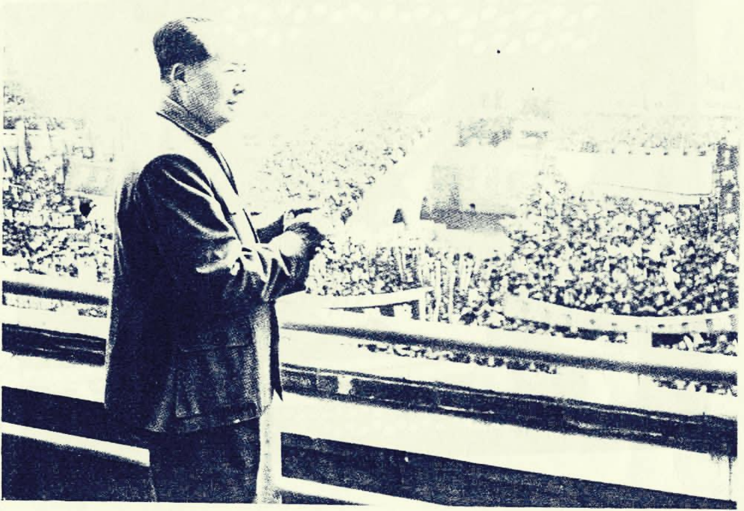
Mao Zedung im Jahre 1967 auf der Kundgebung aller Bevölkerungsdäcase Peking zur Unabhängigkeit des vietnamesischen Volkes in dessen Widerstandskrieg gegen die Aggression des USA-Imperialismus und zur Rettung des Vaterlandes.

yürütürken, sosyalizmin içindeki burjuva ögelerden desteğini alan yeni tip burjuvazinin de sosyalizmin tüm eşitsizlik ve dengesizliklerini yaygınlaştırma, bu gedik üzerinde palazlanarak sosyalizmin içindeki burjuva ögelerden kapitalizmi restore etme mücadelesi yürütmektedir.