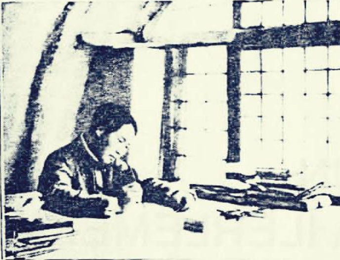
Mao in a Yenren cave in 1938.